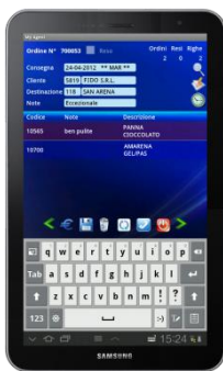
Maschera My Agent

L'applicazione installata in sede, con la quale si gestisce l'operatività degli agenti, è altrettanto semplice e richiede un breve periodo di formazione, fornito da Emisfera all'atto dell'avviamento